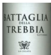
Battaglia della Trebbia Gutturmo Colli Piacentini DOC

Nuvole Italiane cloud computing services